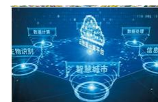
陕西省应急管理厅2023年度应急管理信息系统运维服务项目