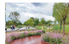
北京温榆河智慧公园项目