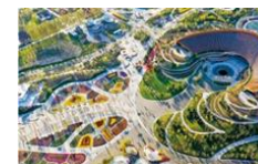
2019年中国北京世界园艺博览会智慧世园项目