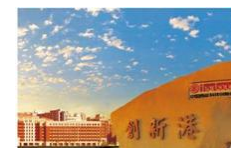
中国西部科技创新港“智慧学镇”建设项目